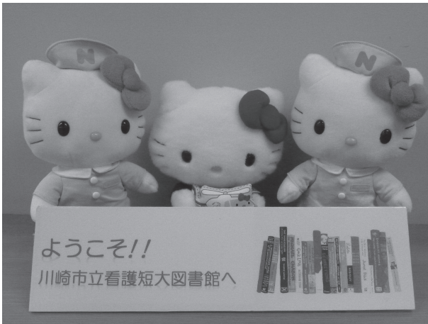
写真1 ナースキティがお出迎え

今回、先生方の珠玉の一冊の紹介文を3年分ここに掲載します。それぞれの想いを感じお読みいただけましたら幸いです。